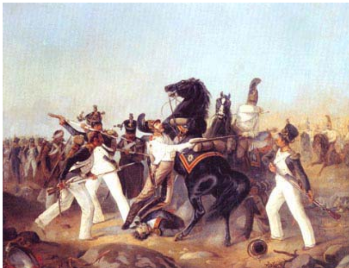
А.И.Шарлемань. Взятие лейб-гвардии Конным полком французского знамени 4-го линейного полка под Аустерлицем. 1805 год. 1852