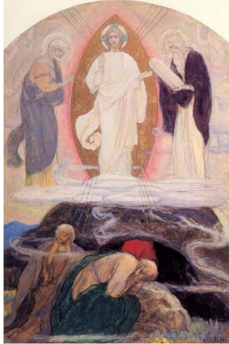
М.В. Нестеров. Преображение Господне

Примечание для педагога: Здесь можно поговорить с учениками о том, когда христиане празднуют Преображение Господне (Пасха) и в чем сакральный смысл этого праздника. Следующий шаг в обсуждении – решение вопроса о том, что или кто являлся для Толстого Богом в период написания сцены с дубом в романе «Война и мир» - слово, человек или природа.