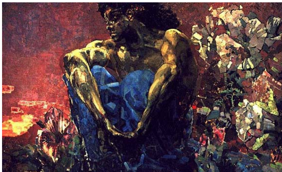
Иллюстрация: М.А. Врубель «Демон сидящий». Из собрания Государственной Третьяковской галереи в Москве.

Можно ли сказать, что символом всех Творцов – поэтов, писателей, ученых – и символом рубежа веков стал «Демон» М.А. Врубеля