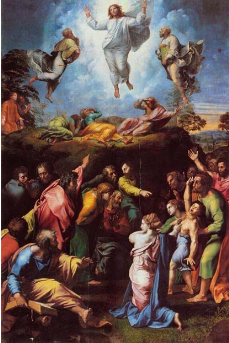
Рафаэль Санти. Преображение 1518-1520. Темпера, масло, дерево. Рим, Ватиканская пинакотека